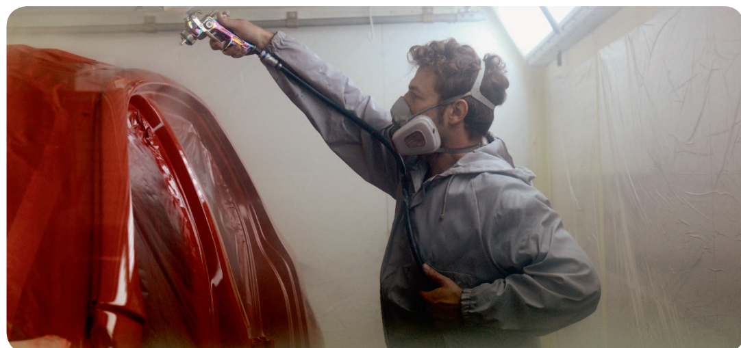
Lassen Sie sich beim Ausflug in die Lackiererei vom Farbenreichtum der Umgebung verzaubern.

h autohauser ® ... garantiert die form .