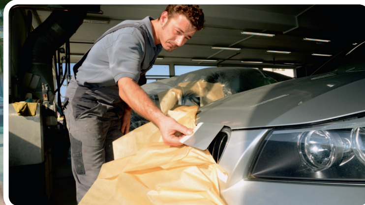
Passts so? Ihre Zufriedenheit steht an oberster Stelle.

Möglicher Auszug aus dem Prospekt eines Ferienveranstalters: «Die Reparatur eines Unfallschadens an einem Fahrzeug soll so ausgeführt sein, als hätte es nie einen Schaden gegeben. Bei modernen Autos eine grosse Herausforderung für Reparaturbetriebe. Die Entwicklung in der Autoherstellung galoppiert stetig voran. Die Schlagwörter sind: Neue Materialien, neue Verbindungstechniken, zunehmend höhere Sicherheitsstandards und immer ausgefeiltere Lackierungen. Da sind bei der Unfallinstandstellung Fachleute und Infrastrukturen gefragt, die mit dieser Entwicklung Schritt halten. Nehmen Sie ein paar Tage Ferien und gucken Sie solchen Experten bei der Arbeit an Ihrem Auto über die Schulter. Zum Beispiel bei autohauser in Oftringen.»