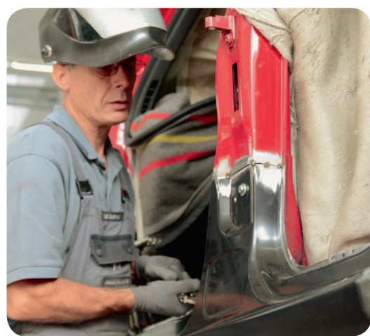
Reisen bildet. Beim Carrossier lernen Sie Verbindungstechniken kennen.

Ob Feriengast oder nicht: wer autohauser sein Auto zur Reparatur anvertraut, hat Anrecht auf einen Gratis-Ersatzwagen. Die Ersatzwagenflotte deckt vom Kleinwagen bis zum Premiumfahrzeug verschiedenste Kundenbedürfnisse ab.